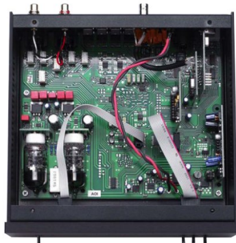
Weil das Laufwerk (links) neben üblichen Audio-CDs auch CDDAs oder CD-ROMs mit MP3- oder FLAC-Files (bis 24/96) abspielen kann, hat es eine eigene Hardware-Decoder-Plattform an Bord (Blue Tiger CD 100), die auch gleich für das (zuschaltbare) zwei- oder vierfache Daten-Upsampling zuständig ist. Der D/A-Wandler (rechts) erlaubt direktes Umschalten beim Hören zwischen Röhren- und Transistor-Ausgangsstufe.