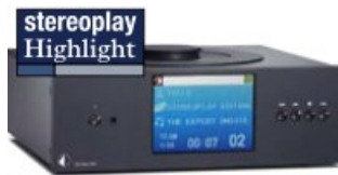
Pro-Ject CD + DAC Box RS 2000 Euro (Herstellerangabe)

Pro-Ject CD Box RS und DAC Box RS sind für sich allein bereits tolle Komponenten, via Sonic verbandelt sogar ein echtes Traumpaar. Ein klarer Beweis, dass es sich mit der CD auch künftig wunderbar leben lässt. Ein Extralob hat auch das Laufwerk verdient: Es zeichnet sich durch ein kaum hörbares, mechanisches Laufgeräusch aus. Jürgen Schröder ■