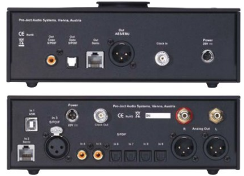
Sowohl das Laufwerk (oben) als auch der Wandler bieten digitale Anschlüsse in Hülle und Fülle. Die Sonic-Digitalverbindung erfordert neben dem RJ-45- auch noch ein BNC-Kabel für das Clock-Signal. Die Netzteile beider Geräte sind ähnlich wie bei Laptops ausgelagert.