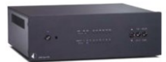
Pro-Ject DAC Box RS 950 Euro (Herstellerangabe)